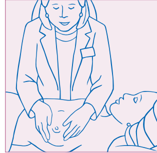
Examen clínico del seno